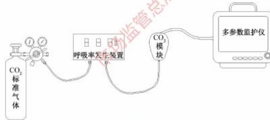
图 2 呼末二氧化碳参数检测示意图

如图 2，采用浓度为 5.0% 体积百分比 CO 2 标准气体（相当于大气压为 760 mmHg 的条件下分压为 5 kPa 或 38 mmHg），搭建好检测系统。呼吸率设为 20 次/min，等监护仪进入正常工作状态之后，连续读取 3 次呼吸的测量结果，按式 (10) 计算呼末二氧化碳浓度示值误差，应符合 5.11 的要求。